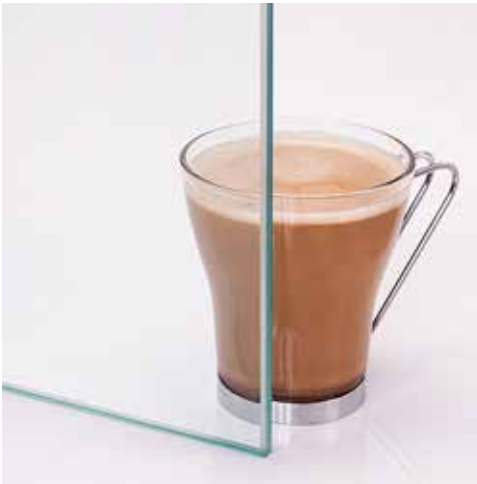
Klar Clear Clair Kirkas Прозрачное