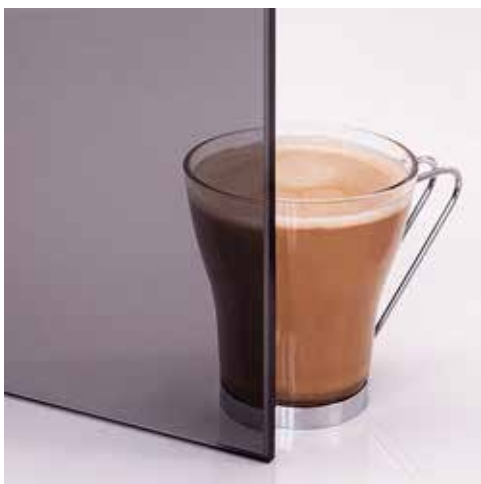
Grau Grey Gris Hall Серое