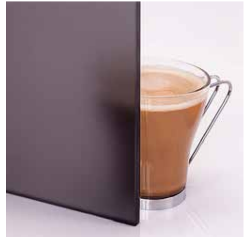
Mattgrau Matted gray Matt gris Matistatud hall Мат. серое