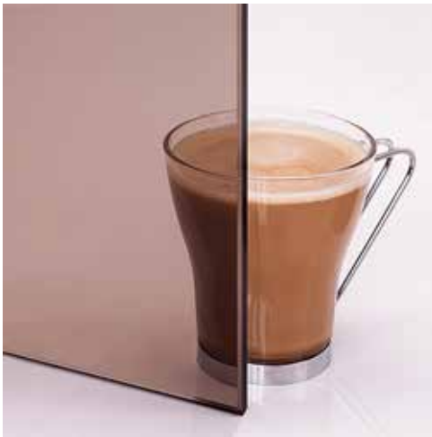
Bronze Bronze Bronze Pronks Бронза