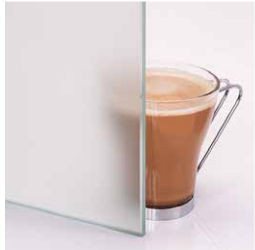
Mattklar Matted clear Matt clair Matistatud kirkas Матовое