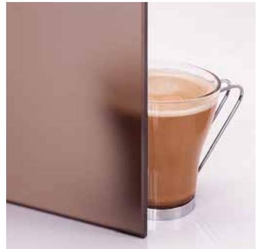
Mattbronze Matted bronze Matt bronze Matistatud pronks Мат. бронза